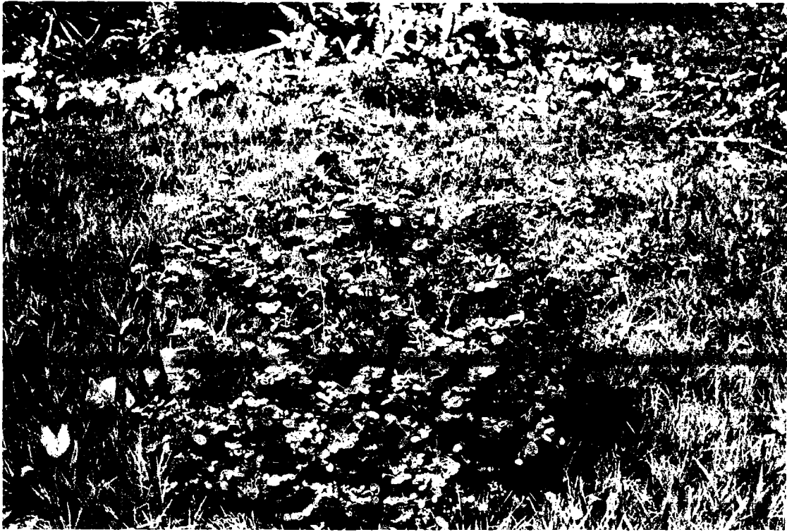
Fig. 7 Euphorbia aff. atoto dans une pelouse de Lepturus repens .