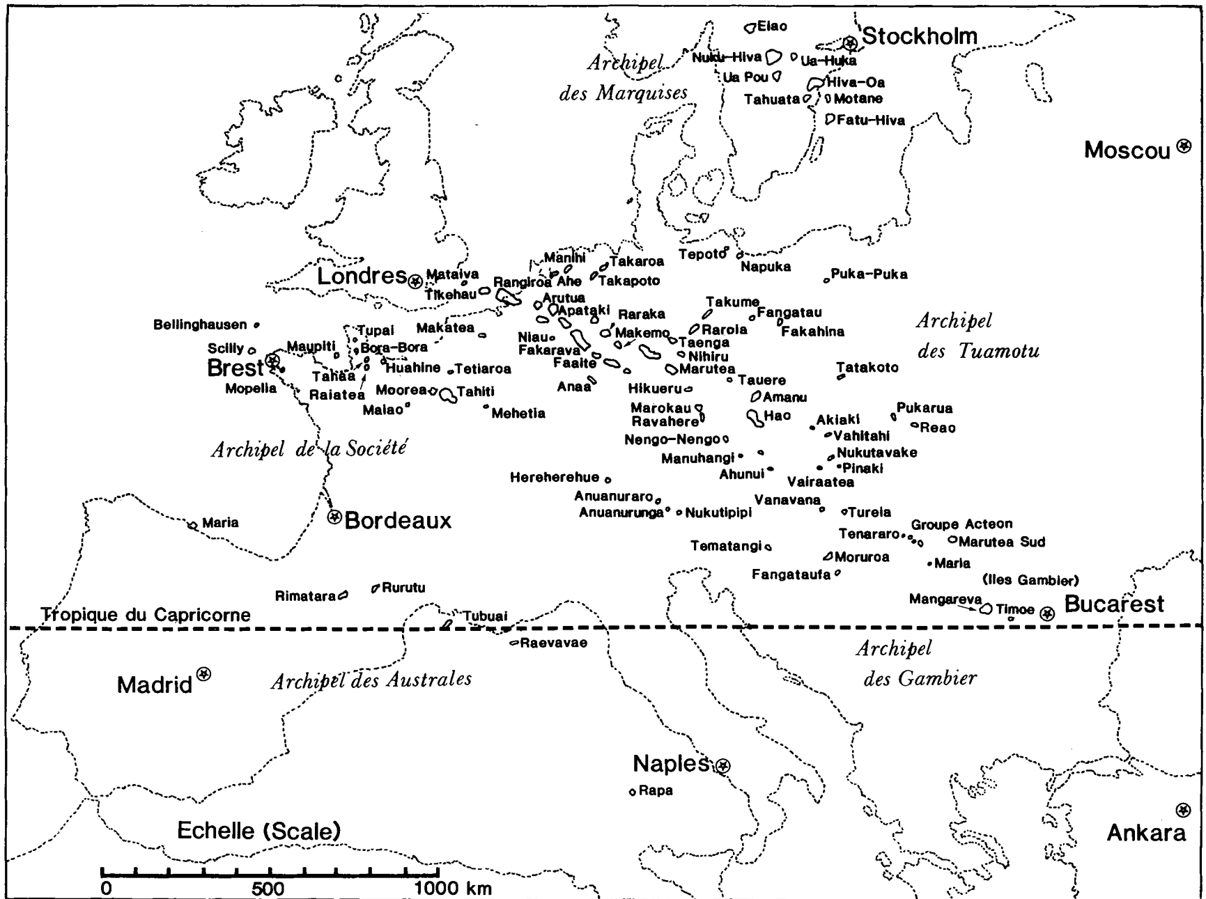
Fig. 1. La Polynésie Française. Dispersion géographique des îles comparée à l'Europe. D'après une carte de G. Richard, 1982.