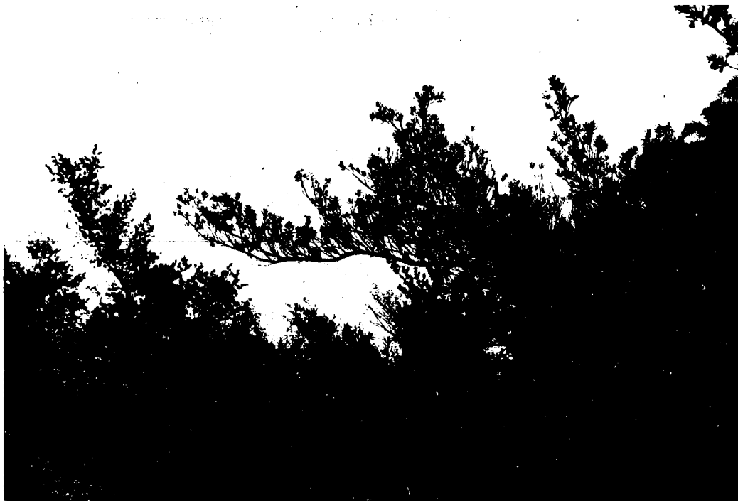
Fig. 2 Suriana maritima dans un fourré d'espèces diverses longeant la cocoteraie côté océan. (Figs. 1-8, Sachet, Dec. 1974).