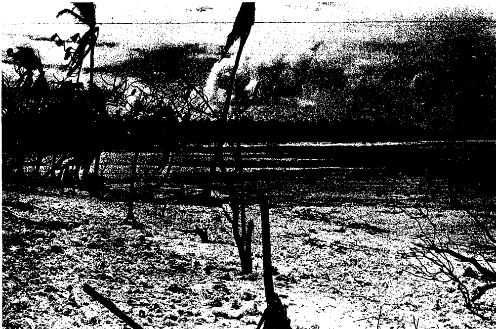
Fig. 16 Dépôt d'une couche de débris coralliens et destruction de la végétation au sud de la passe Apooparai, côté océan. Vue vers le N.