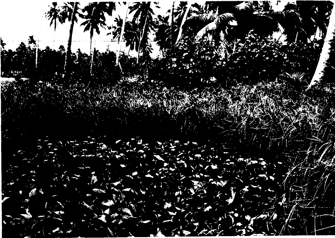
Fig. 6 Mare à Nymphaea entourée de Cyperus javanicus et Hibiscus tiliaceus .