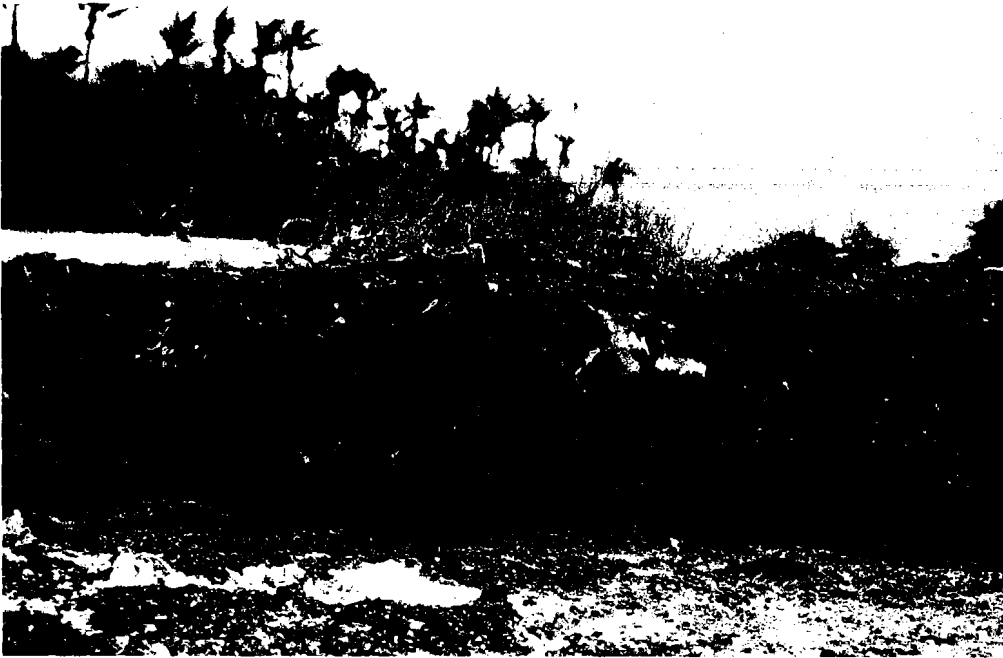
Fig. 13 Détail de la Fig. 12, montrant des taches blanches là où Reva a arraché des plaques au rocher (les surfaces anciennes sont noircies par la présence de cyanophycées). Les arbustes défeuillés sont probablement Pemphis acidula .