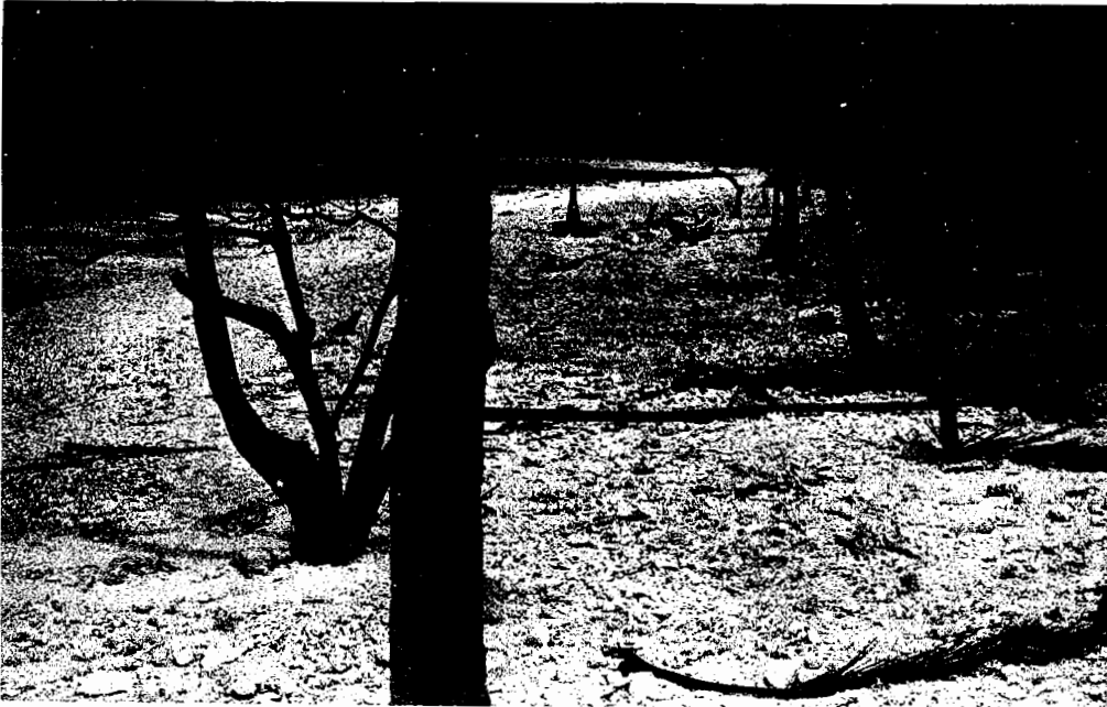
Fig. 18 Môme site que Figs. 16 et 17, mais vue prise vers le Sud. (Photos 11-18 prises par B. Salvat, 22 Juin 1983).