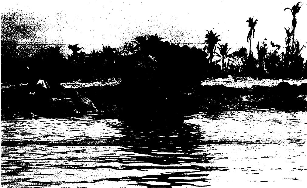
Fig. 11 Plateforme de conglomérat récifal avec rocher perché amené par une ancienne tempête et dont une partie a été arrachée par le cyclone Reva (10 Mars 1983). Au sud de l'entrée de la passe Apooparai, côte Est.