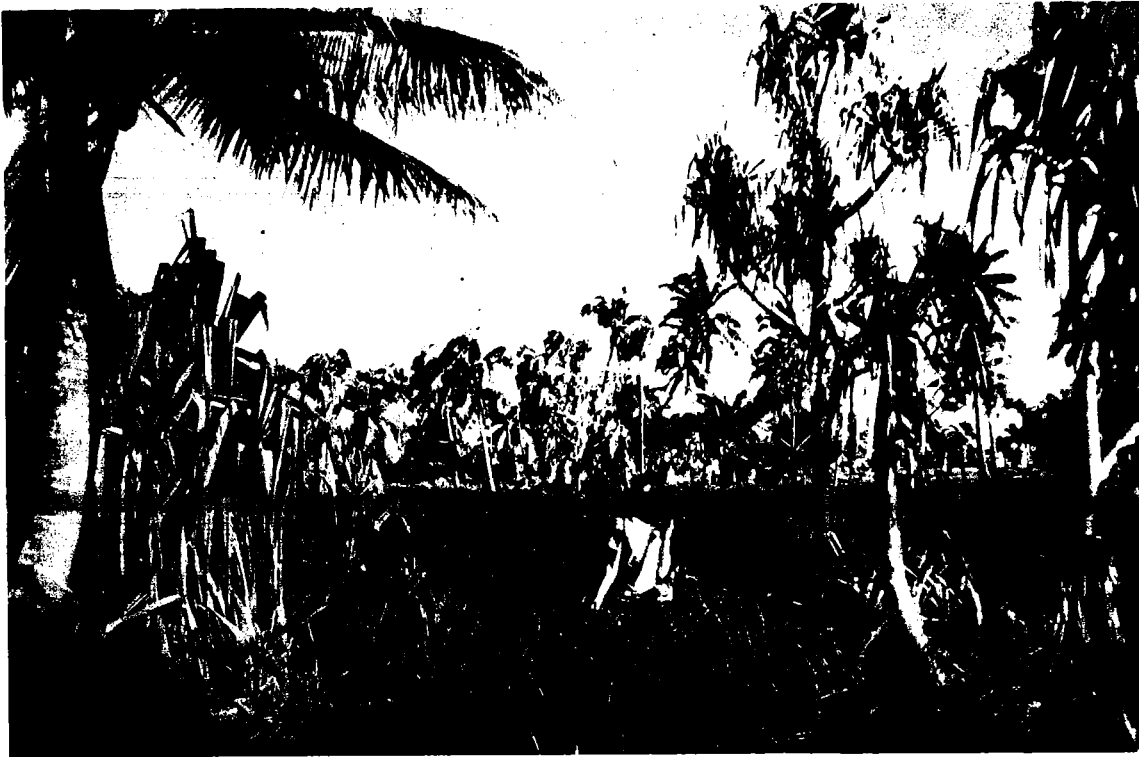
Fig. 5 Marécage vers la pointe E, avec Cladium jamaicense et Pandanus . (Mars 1983).