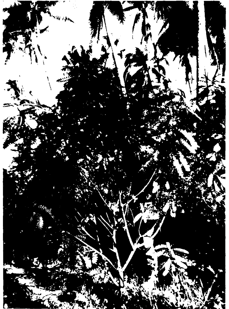
Figs. 9, 10. Sous-bois de Sesbania coccinea , s.l. Photos de B. Delesalle et Sachet, 3 Mars 1983.