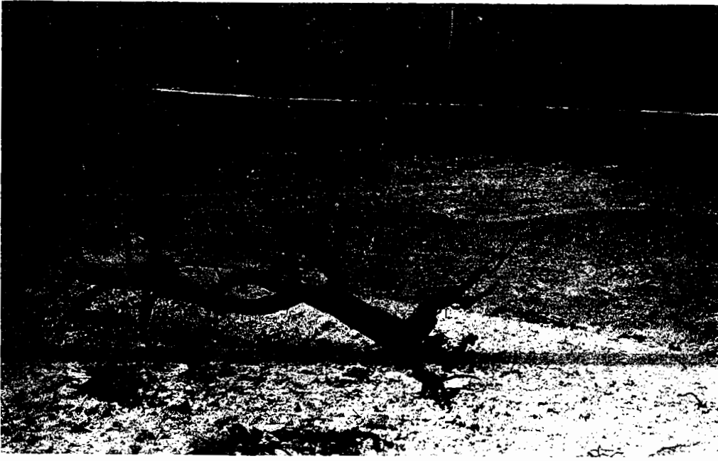
Fig. 17 Môme site que Fig. 16, vue prise vers le NE.