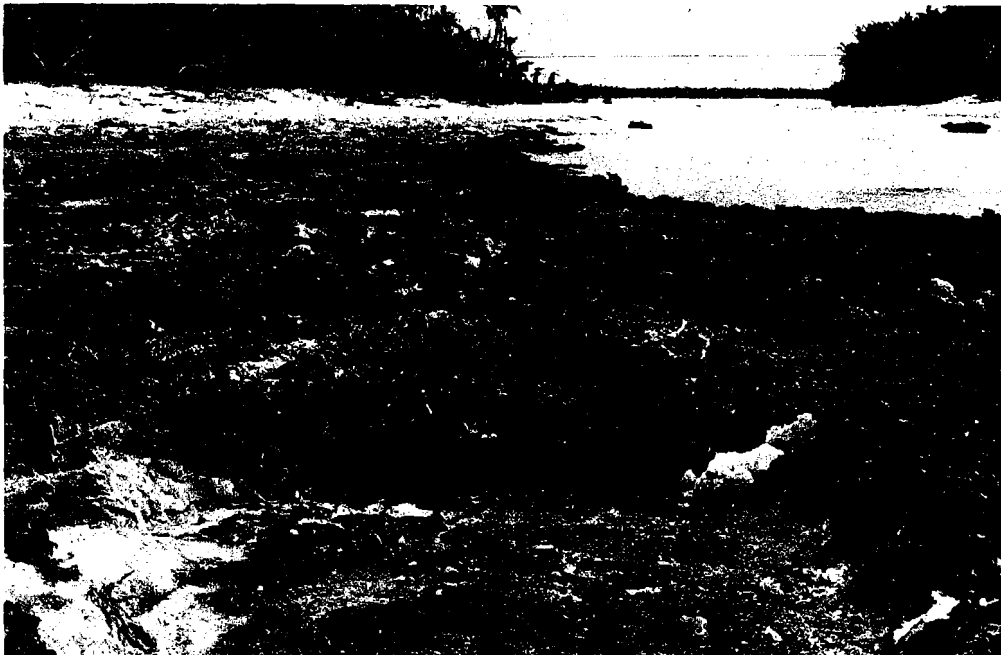
Fig. 12 Plateforme de conglomérat découvert, rive sud de la passe Tetapae, côte Est.