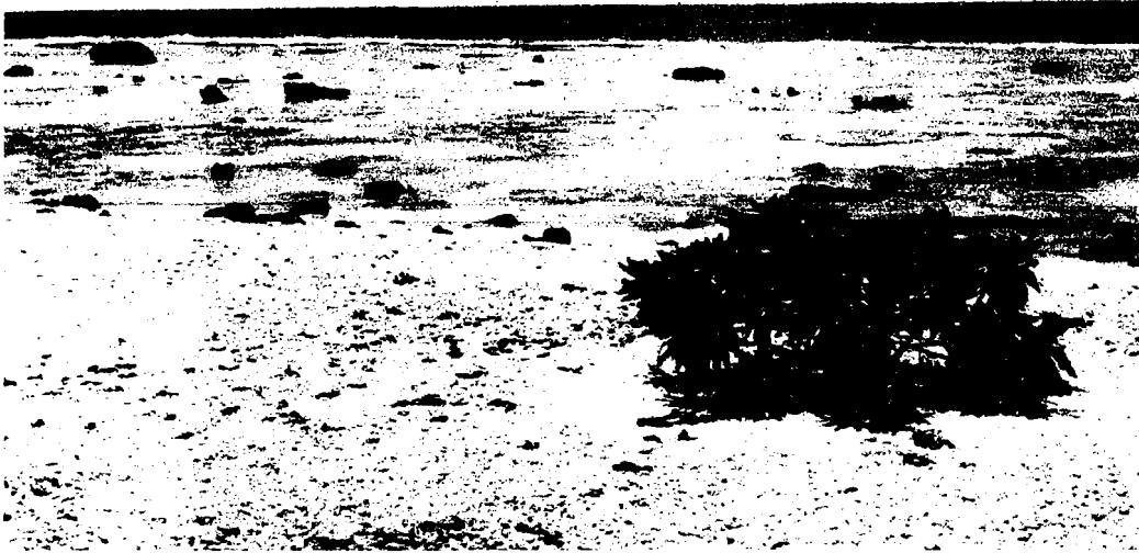
Fig. 1 Tournefortia argentea sur la plage, côte E; platier du récif semé de blocs de corail noirci.