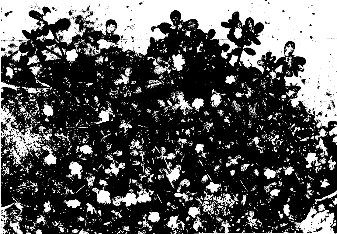
Fig. 8 Plant de Portulaca fosbergii a feuilles charnues et fleurs jaunes.