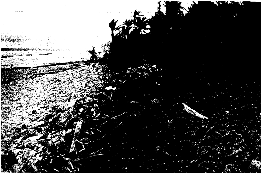
Fig. 14 Galets et débris coralliens grossiers (blancs) rejetés par Reva contre une levée (grise) plus ancienne. Pointe Rae, sud de l'atoll.