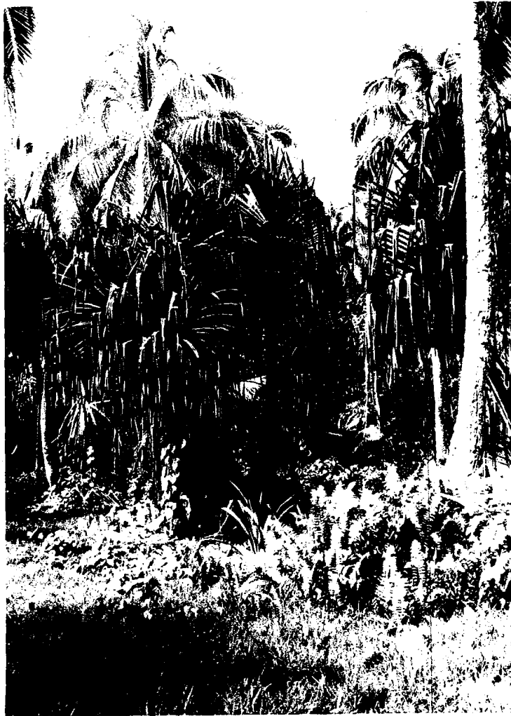
Fig. 3 Intérieur de la cocoteraie avec Pandanus , Ipomoea macrantha et fougères ( Nephrolepis sp.) en sous-bois.