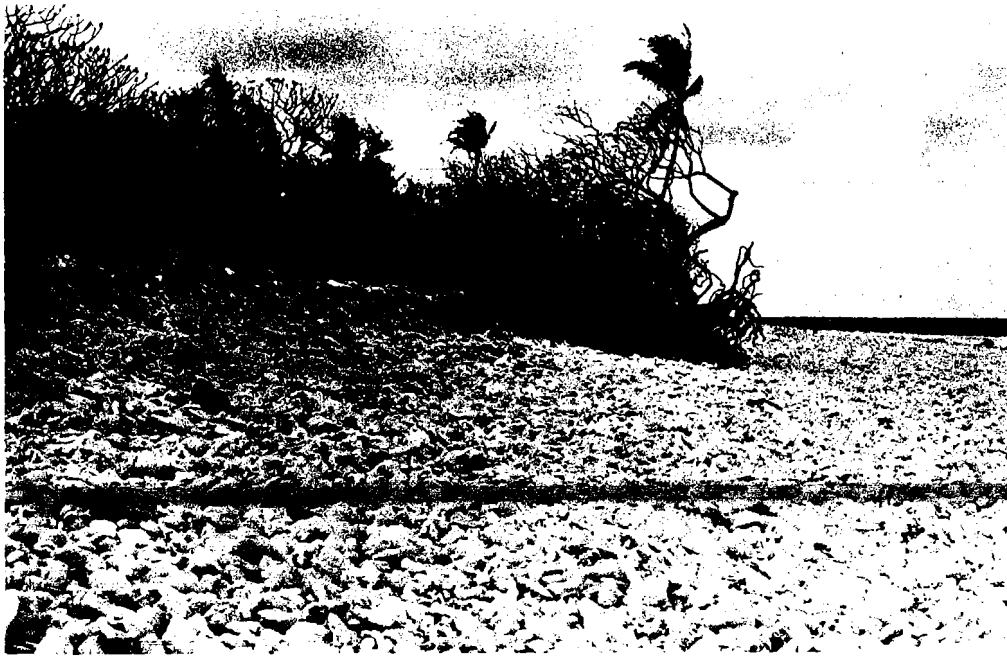
Fig. 15 Crête de débris grossiers accumulée par Reva, juste au Sud de la Fig. 14. Végétation côtière défeuillée ou tuée.