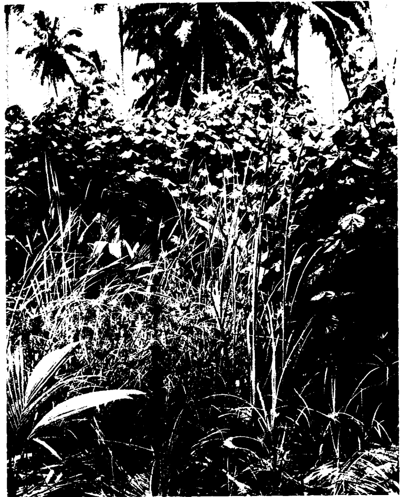
Fig. 4 Hibiscus tiliaceus autour d'une mare avec Cyperus javanicus et quelques Typha sp.